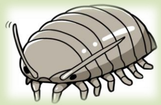
ダイオウグソクムシ